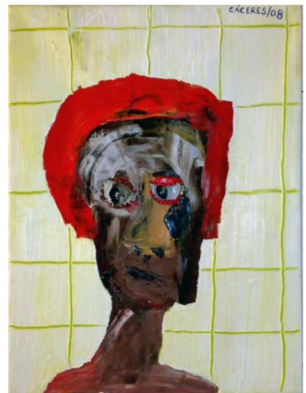
La Inmigrante. Mixta y Collage s/tela.