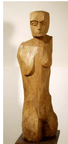
Figura. Talla en madera. H70 cm