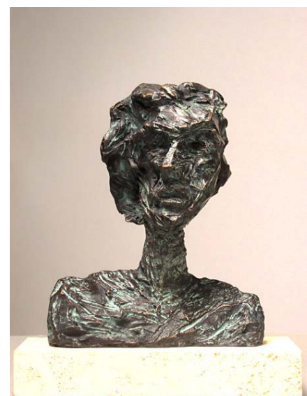
Cabeza. Bronce patinado. H17cm