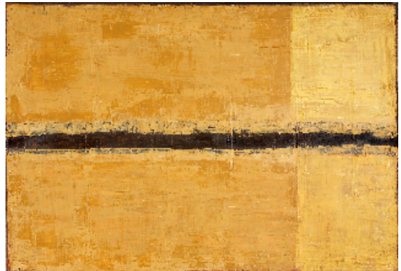
S/T. Mixta sobre tela.