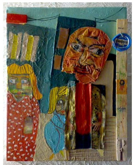
El Raval. Mixta y Collage s/tela.