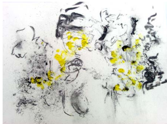
Carbonishas. Carboncillo y pastel s/papel.