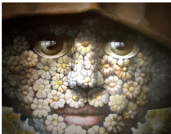
Carita de flores. Acrílico s/tela.

Primer Premio Salón de la Vendimia Argentina, Museo de la Caricatura de México, Salón de la Amistad y Concurso de Afiches Che Guevara, Cuba.