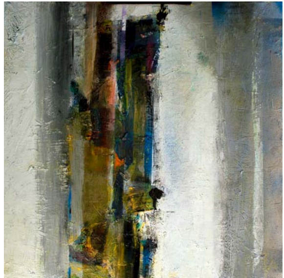
S/T. Óleo s/tela.

1998 Ilustración de tapa del libro " Primer Encuentro de Escritores Jóvenes", Centro de Expresiones Contemporaneas, Rosario.