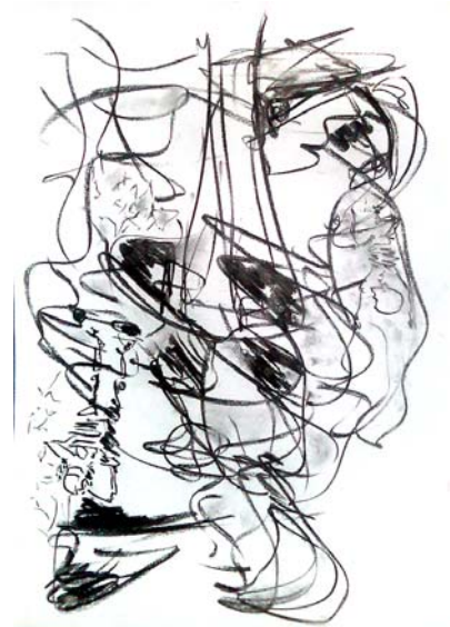
Carbonishas. Carboncillo s/papel.

Últimas exposiciones individuales y colectivas de sus trabajos de vídeo y vídeo instalaciones MMAMM, Mendoza Argentina, marzo del 2009, Galería Espai Ample Barcelona, agosto-noviembre 2009, Red 03 Barcelona Noviembre 2009.