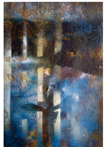
S/T. Óleo s/tabla