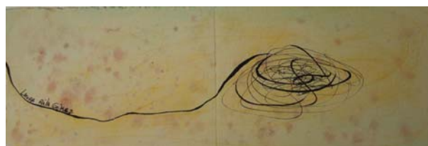
S/Título. Mixta y tinta s/ papel.