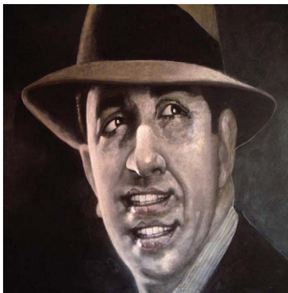
Cada día canta mejor. Acrílico s/tela.