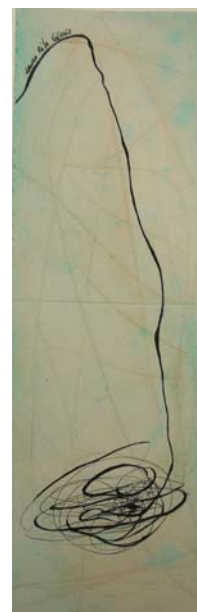
S/Título. Mixta y tinta s/ papel.