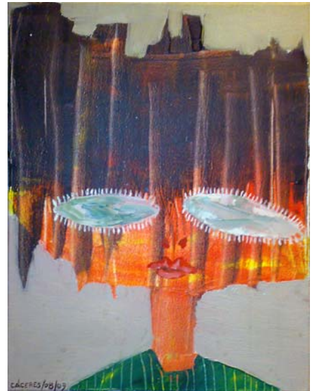
Niña Moderna. Mixta y Collage s/tela. 30 x 40cm.