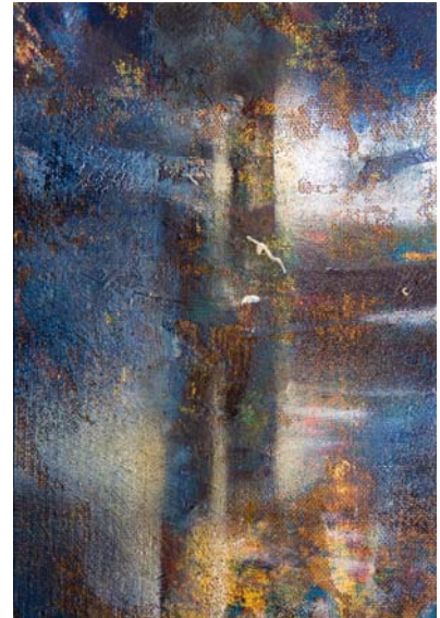
S/T. Óleo s/tabla