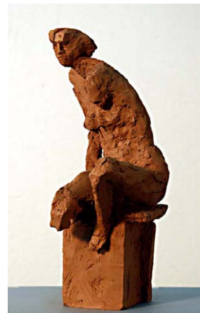
Figura. Barro cocido. H30cm