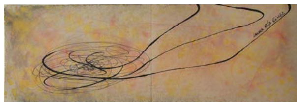
S/Título. Mixta y tinta s/ papel.