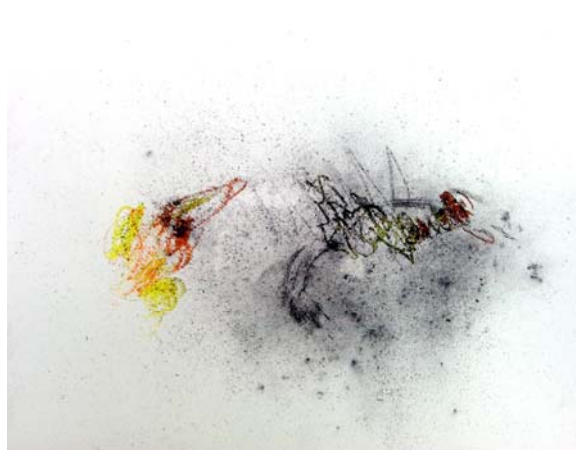
Carbonishas. Carboncillo y pastel s/papel.