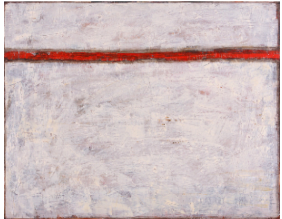
S/T. Mixta sobre tela.

Expone desde 1983 en Argentina, Alemania y España.