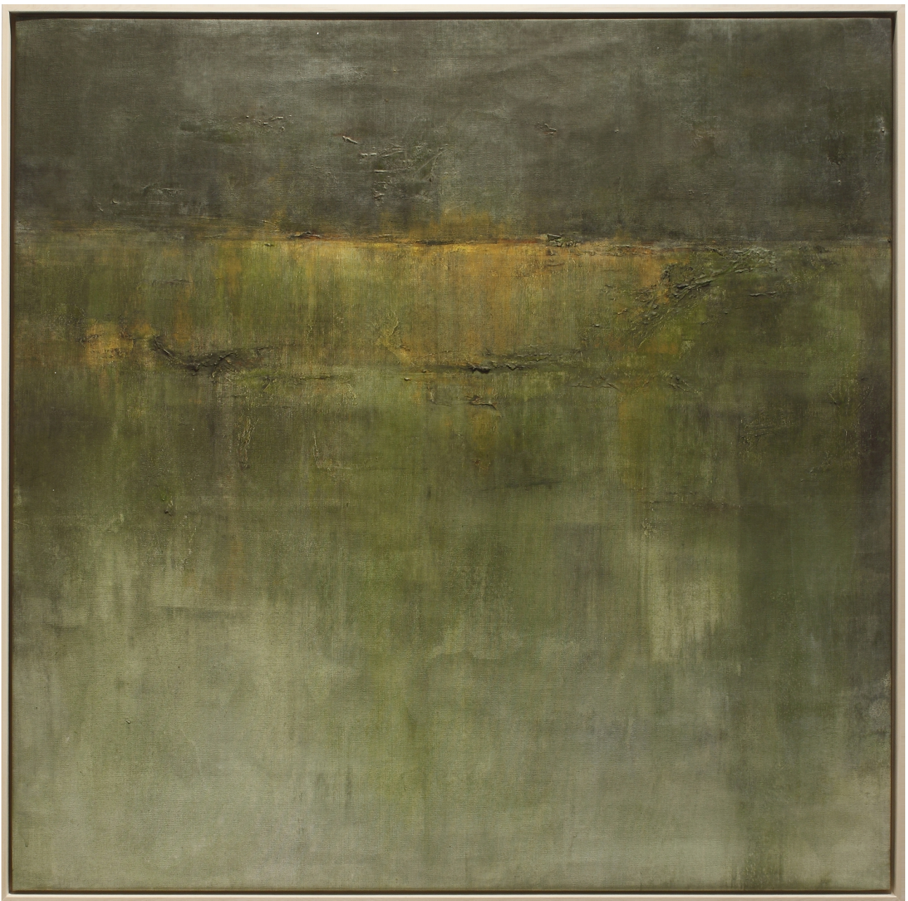
Acrílico sobre canvas, 100 x 100cm, enmarcado caja americana ayous, 103 x 103 x 3,5cm

La utilización de capas transparentes permiten ver diferentes tonalidades de color que se superponen y combinan para crear una sensación de profundidad y luminosidad en la obra.