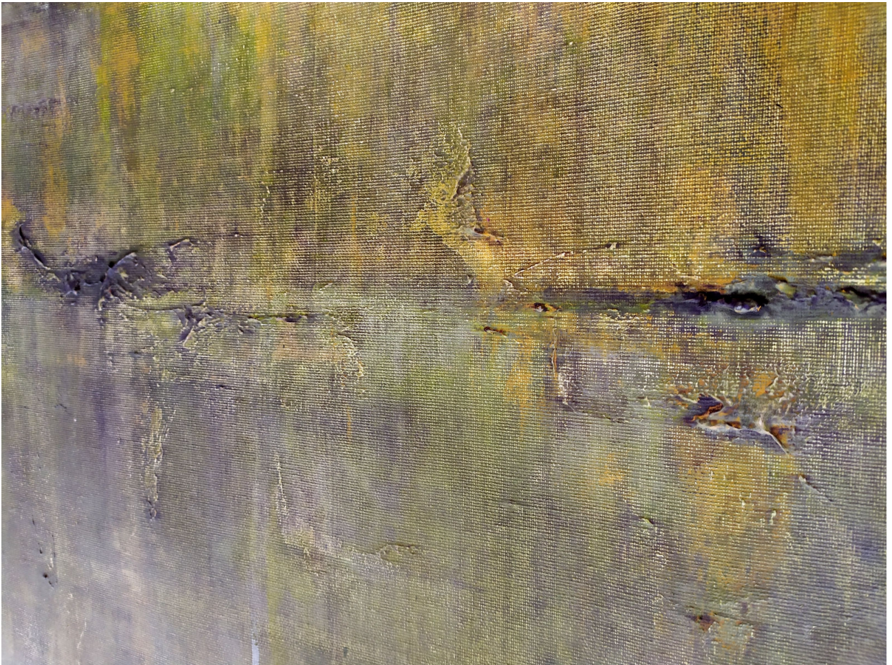
Paisaje 1346 detalles