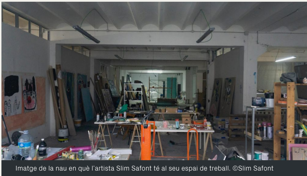
Imatge de la nau en què l'artista Slim Safont té al seu espai de treball. ©Slim Safont

col·labora en el que ara treballen una vintena d'artistes com hem vist l' Associació Cultural Malpaís i també participen en els Tallers Oberts amb una exposició conjunta.