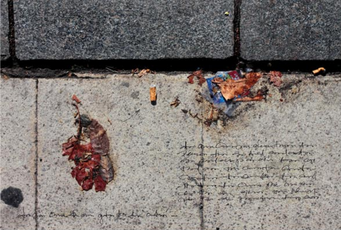
La mirada del Otro #37 Fotomontaje digital Papel Canson Edition Etching Rag, 310g. Archival Pigment Print, 297 x 420 mm