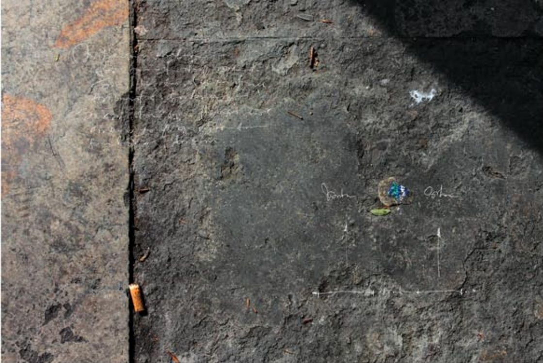
La mirada del Otro #36 Fotomontaje digital Papel Canson Edition Etching Rag, 310g. Archival Pigment Print, 297 x 420 mm